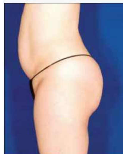
Reducción de 3 cm tras una sesión con VelaShape III