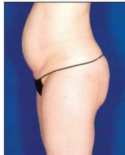
Antes del tratamiento

El doctor Gold avala esta opinión, e indica que la sinergia de la energía óptica y eléctrica facilita el calentamiento del tejido de una forma más rápida y profunda. “En comparación con versiones anteriores, el dispositivo VelaShape III funciona un 40% más rápido. La energía de radiofrecuencia se ha intensificado para obtener resultados más espectaculares y rápidos en un periodo de tiempo más breve. Como resultado del aumento del metabolismo celular, la estimulación de la actividad fibroblástica y la remodelación de la matriz extracelular, hemos observado una mejora global de la textura y estructura de la piel,” según indica el doctor.