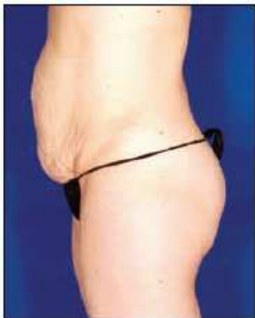
Antes del tratamiento

“A pesar del aumento de potencia, el tratamiento continúa siendo cómodo para el paciente y el protocolo simplificado es una ventaja adicional.”