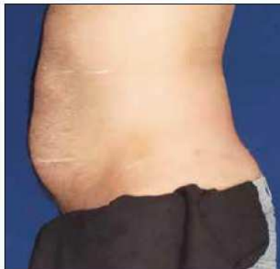
Antes del tratamiento

“El dispositivo ha recibido la aprobación correspondiente para la reducción temporal de la celulitis, pero creo que la radiofrecuencia bipolar le confiere el potencial necesario para la remodelación de larga duración. También es muy útil para utilizarlo conjuntamente con otros métodos que eliminen la mayor parte de grasa.”