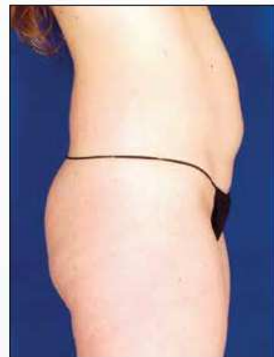
Antes del tratamiento

El doctor Gold cree que el dispositivo aplica el tratamiento adicional perfecto tras una intervención quirúrgica. “Normalmente lo utilizamos conjuntamente con las liposucciones o abdominoplastias, en parte por su acción masaje, pero fundamentalmente porque mejora la calidad de la piel,” comenta el facultativo.