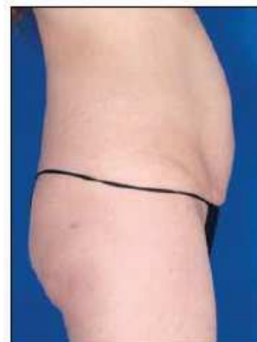
Antes del tratamiento

La doctora Brightman cree que es importante destacar que hay formas diferentes de utilizar los niveles superiores de energía del dispositivo, de forma que el médico pueda añadir más opciones de tratamiento. “Antes de tener VelaShape III, aplicábamos de cuatro a seis sesiones en la misma parte del cuerpo una vez a la semana, lo que suponía entre 20 y 25 minutos. Ahora se aplican menos sesiones y de menor duración, normalmente tres sesiones de una duración aproximada de 15 minutos cada una, en un intervalo de dos semanas. O bien una sola