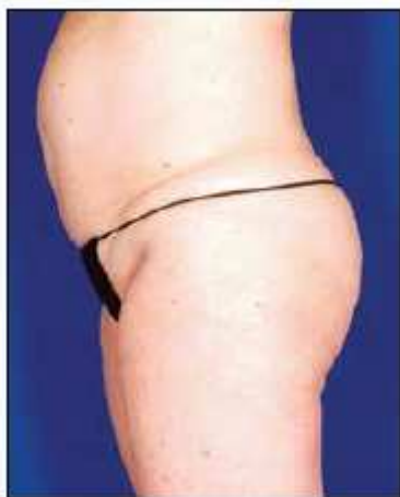
Antes del tratamiento

“Con el uso de la energía de radiofrecuencia el profesional que aplica el tratamiento puede centrarse en las diferentes áreas corporales de forma muy precisa. Puedo reafirmar la piel y al mismo tiempo remodelar el cuerpo del paciente mediante la eliminación de grasa, característica única de este dispositivo.”