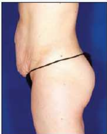
Reducción de 2 cm tras una sesión con VelaShape III