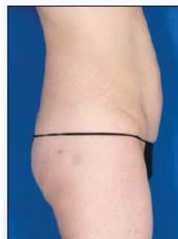
Reducción de 3 cm tras una sesión con VelaShape III