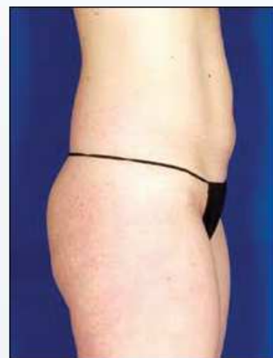
Reducción de 2 cm tras una sesión con VelaShape III