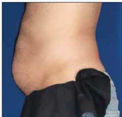
Reducción de 3 cm de abdomen dos semanas después de una sesión con VelaShape III