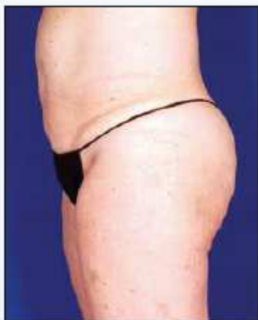
Reducción de 1,7 cm tras una sesión con VelaShape III